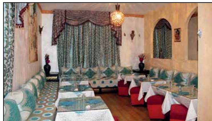
LE DUE SALE ACCOGLIENTI

MENU' ALLA CARTA PIATTI DELLA CUCINA SIRIANA VINO BIANCO-ROSSO-BIRRA-GRAPPA SIRIANI