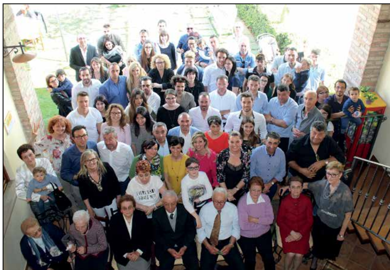
I numerosi rappresentanti della Casata Chiarini "Olempio".