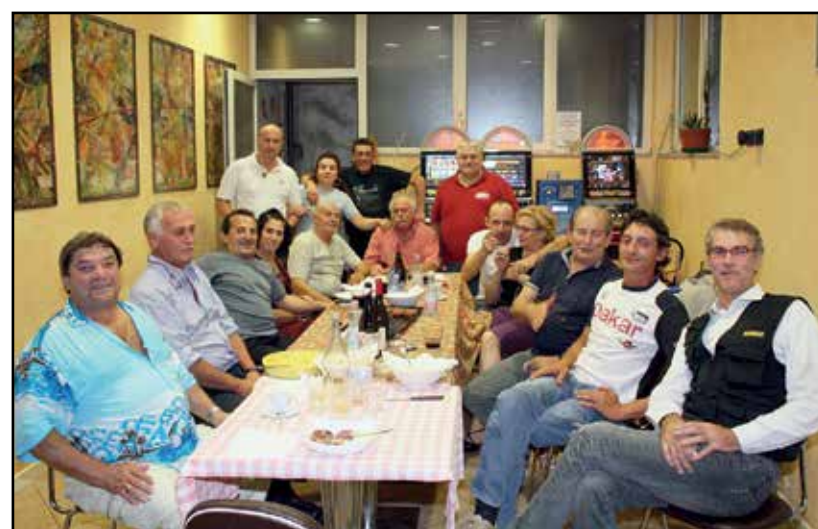
Una delle compagnie che hanno frequentato il Bar Al Cantoncino.

Si era formata una compagnia d'altri tempi, molti personaggi estemporanei con discussioni a non finire davanti ad una buona bottiglia, affettati