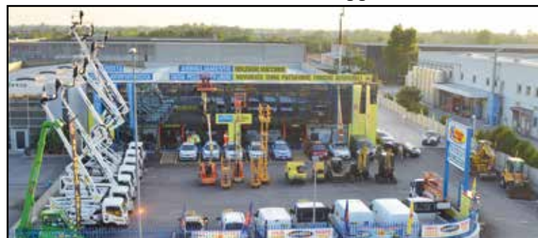
La nuova sede della Noleggio Lorini in zona industriale, via E. Montale 15.

SEDE: MONTICHIARI (BS) - Via E. Montale, 15 FILIALI: CALCINATO - CASTEGNATO tel. 030.9650556 - www.noleggiolorini.com