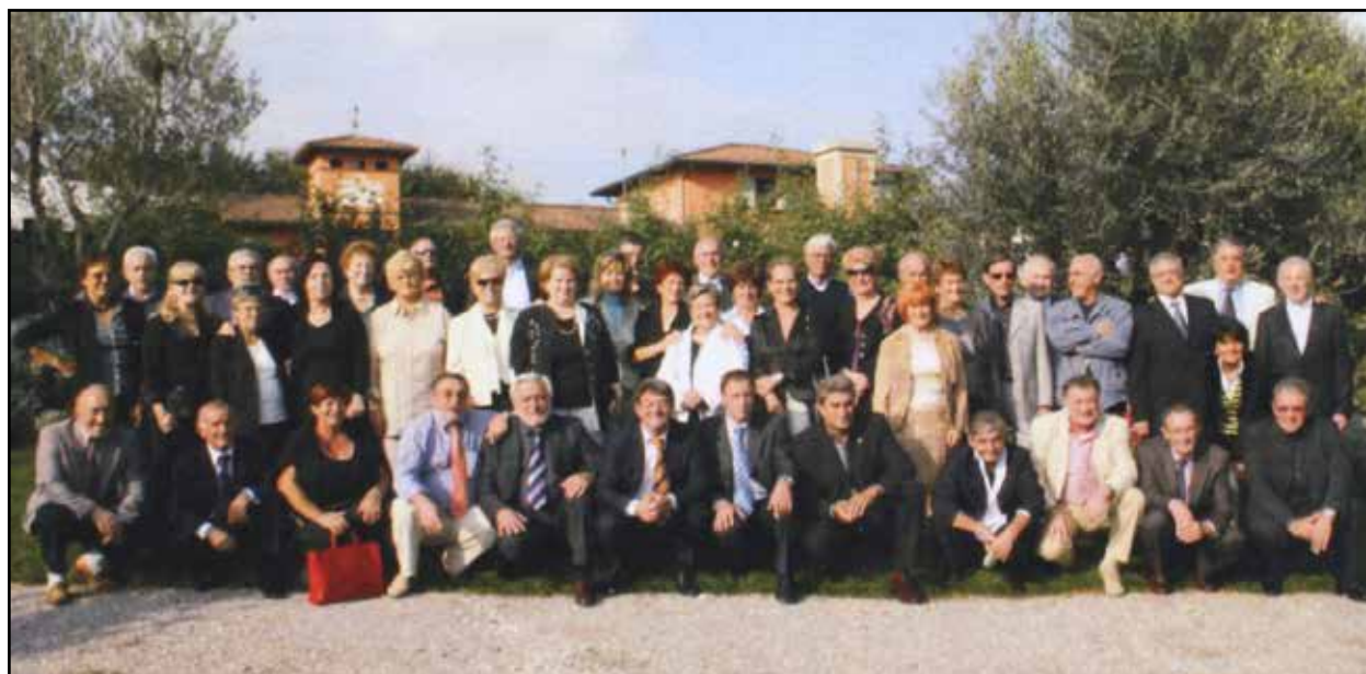
Foto ricordo di una festa che si è svolta presso Corte Francesco.